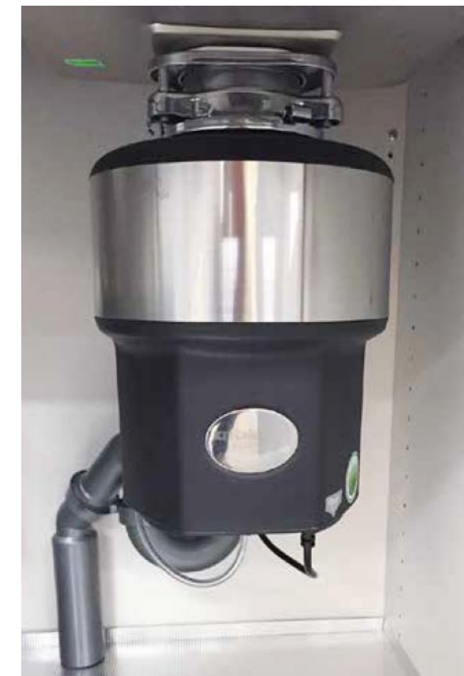
Exempel på hur mycket plats en matavfallskvarn tar under vasken.

Lukt från matavfallskvarnen ska inte uppstå då den i princip är självrengörande. Om det ändå uppstår