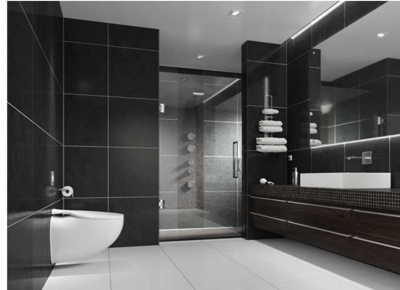
Exempelbild på en vakuumtoalett. Bilden gör inget anspråk på hur badrummen är planerade i fastigheterna i Oceanhamnen eller på materialval.