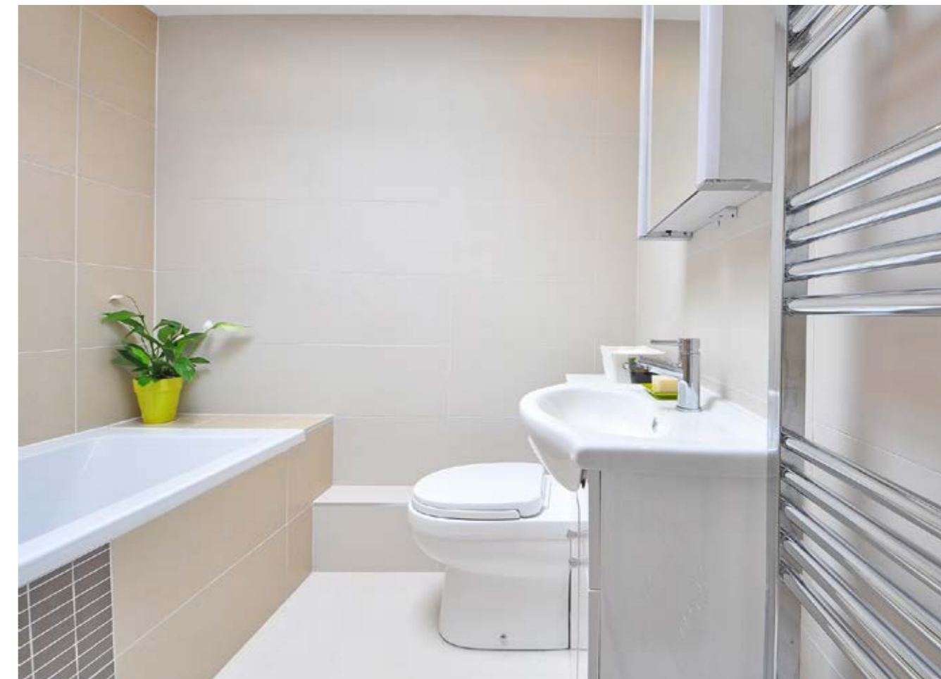
Exempelbild på en vakuumtoalett. Bilden gör inget anspråk på hur badrummen är planerade i fastigheterna i Oceanhamnen eller på materialval.

till genom installation av ett luftfilter på den utgående luften. Sammantaget kan sägas att ett vakuumtoalettsystem är ett slutet system som normalt inte luktar alls, inte ens vid läckage eftersom ledningarna är utsatta för undertryck och ingen luft strömmar från dem. Om systemet eller ledningen stängs av upphör undertrycket och läckaget kommer att lukta.